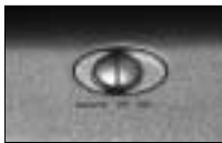
rys. 1 - przełącznik